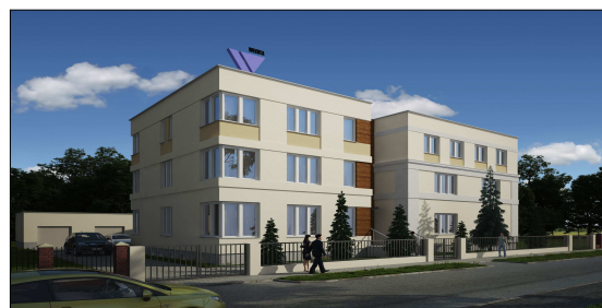
BUDYNEK MIESZKALNO-BIUROWY działka nr 289; BUDYNEK MIESZKALNY WIELORODZINNY działka nr 288 ORAZ BUDYNKI GARAŻOWE działka nr 289 i 288 POZNAŃ UL. WARSZAWSKA 149 i 151