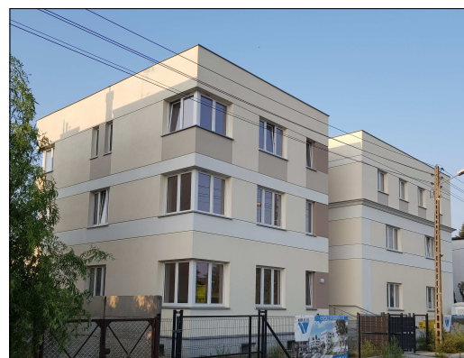
BUDYNEK MIESZKALNO-BIUROWY ORAZ BUDYNEK GARAŻOWY POZNAŃ UL. WARSZAWSKA (działki nr 288 i 289)