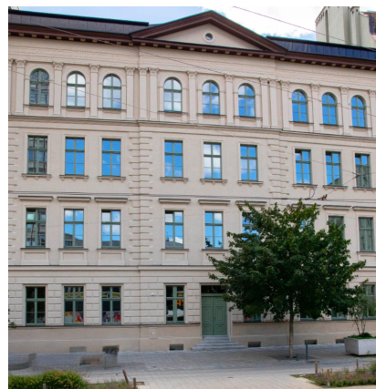
Poznań, ul. Św. Marcin 65