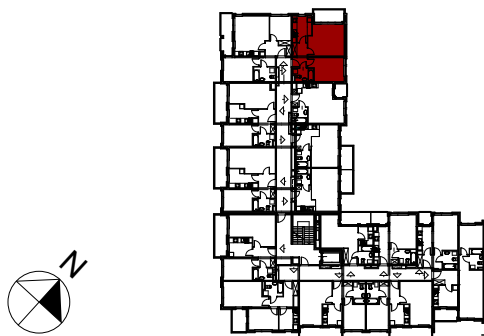
PLAN ORIENTACYJNY - SCHEMAT KLATKI C