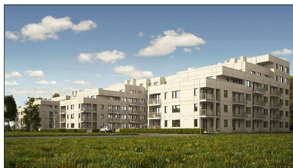
ZESPÓŁ BUDYNKÓW MIESZKALNYCH Z USŁUGAMI TOWARZYSZĄCYMI Poznań, ul. Morzyckańska