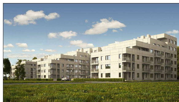
ZESPÓŁ BUDYNKÓW MIESZKALNYCH Z USŁUGAMI TOWARZYSZĄCYMI Poznań, ul. Morzyczajska