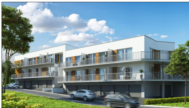
BUDYNEK LETNISKOWY PRZYBRODZIN - nad jeziorem Powidzkim