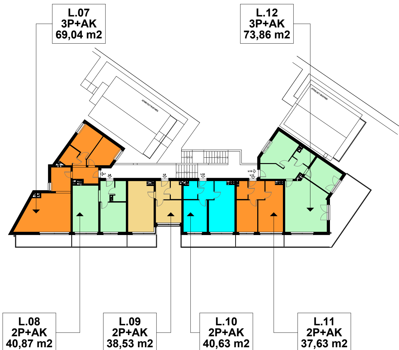
BUDYNEK LETNISKOWY - schemat 1 PIĘTRA